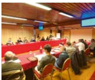
Weiterbildung der Enthomostechniker