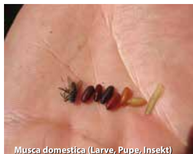
Musca domestica (Larve, Puppe, Insekt)

Die Selektion und Zucht dieser pos. "Nützlingle" vom Typ MULTISPECIE (Spalangia spp. - Muscidifurax spp) ermöglicht es, daß diese Insekten unter verschiedenen Umweltbedingungen ihre Wirkung entfalten, wie bei höheren Temperaturen, Licht, Feuchtigkeit in den Liegeboxen, PH, uvm.