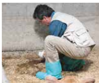
Probeziehung und Befallskontrolle