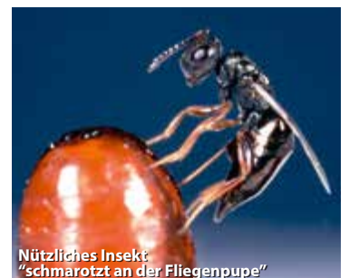
Nützliches Insekt "schmarotzt an der Fliegenpuppe"