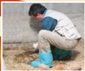
Probeziehung und Befallskontrolle