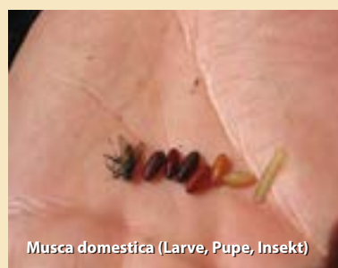
Musca domestica (Larve, Puppe, Insekt)