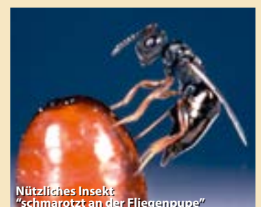
Nützliches Insekt "schmarotzt an der Fliegenpuppe"