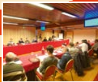
Weiterbildung der Enthomostechniker